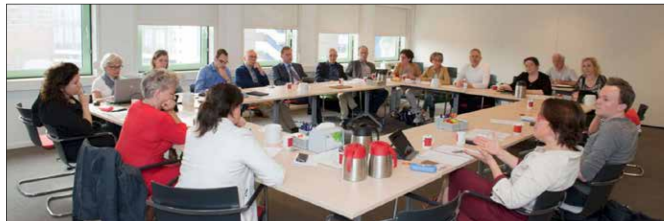
Kennisgroep Aantoonbaar Vorbereid in vergadering.