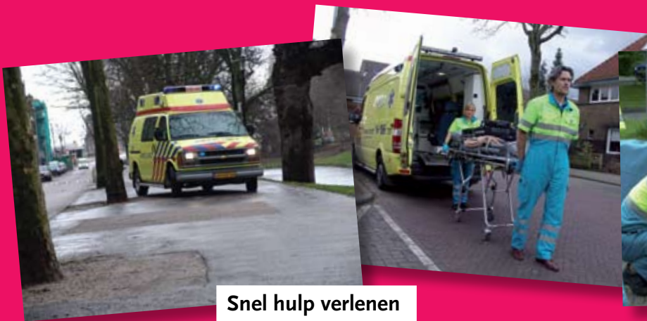
Snel hulp verlenen

van een ambulance soms hard rijden en soms niet? Waar rijdt 'ie dan precies naar toe? En hoe weten de mensen in de ziekenauto waar ze moeten zijn? In dit lesboekje lees je van alles over ambulances. Over hoe het vroeger ging, maar ook over samenwerken met de politie, de brandweer, de huisarts en het ziekenhuis. En over wat er allemaal in de auto zit.